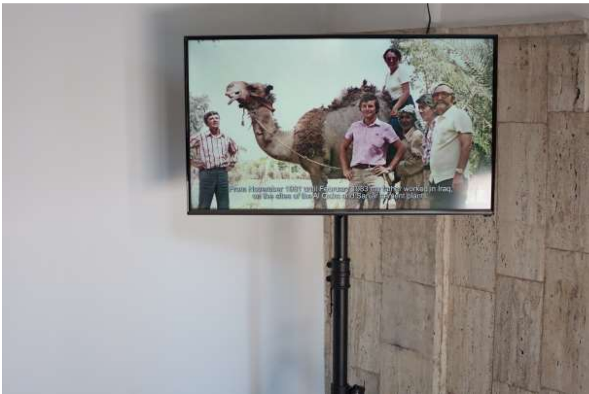
Dan ACOSTIOAEI, Mări Sub Pustiuri , Video/Hd, Color, Sunet, Durată 9'53", 2016