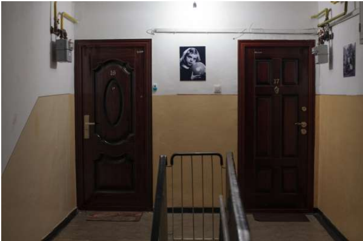
Andrei NACU, Mulțimi, Submulțimi, Familii , proiect în spațiul public, 3 expoziții de fotografie în scări de bloc din cartierul Nicolina din Iași, 2017